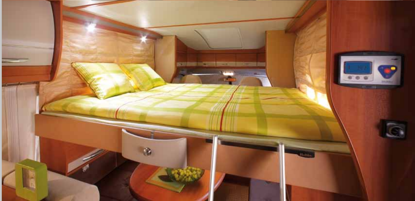
Oben: Hubbett unter dem Wagendach über der Sitzgruppe Unten: Hubbett in Schlafposition